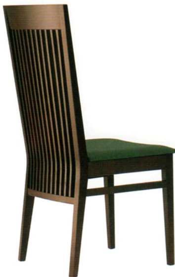
1 サルミ 1N