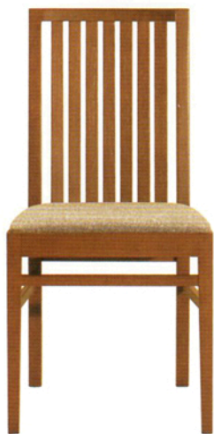
3 レウス 3N