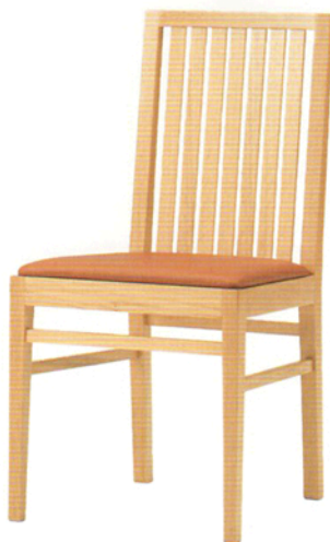
2 レウス 5N