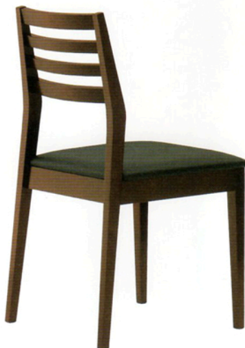
4 ラモ 1N