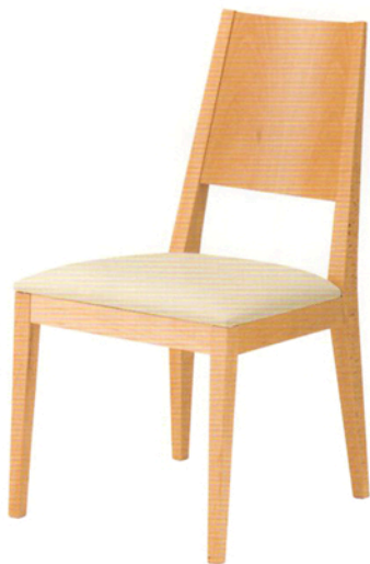
1 ハリスン 5N