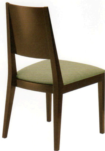
2 ハリスン 1N