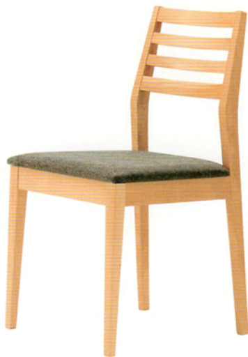
3 ラモ 5N