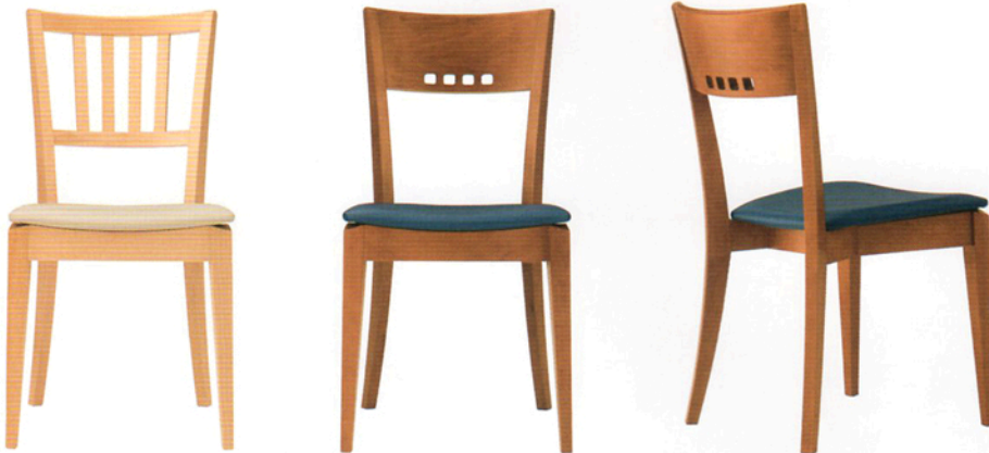
4 ポシェ 5N