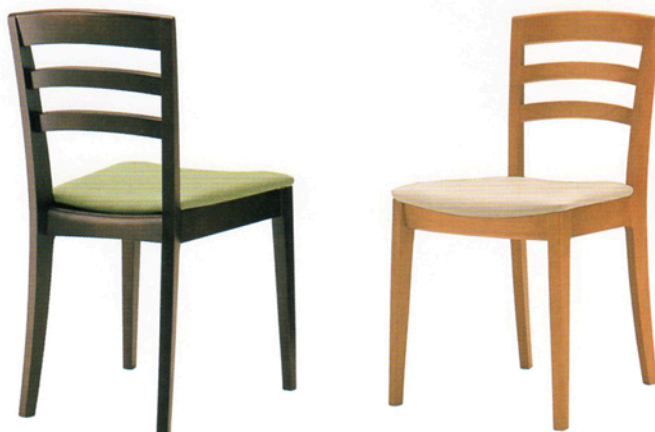
6 ロタ 8N