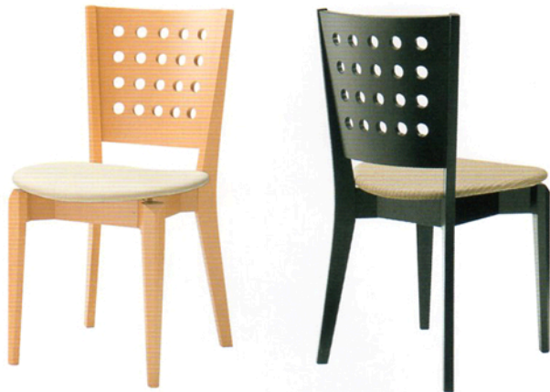
1 シャルテ 5NA