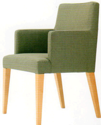
3 レクストN WB-2 5N