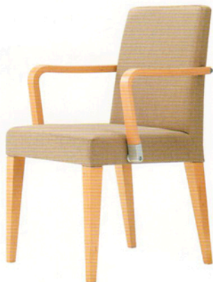
2 レクストN WA-1 5N