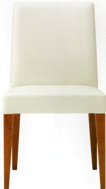
1 レクストN M-2 3N