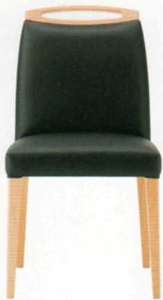
1 アモード M1 5N