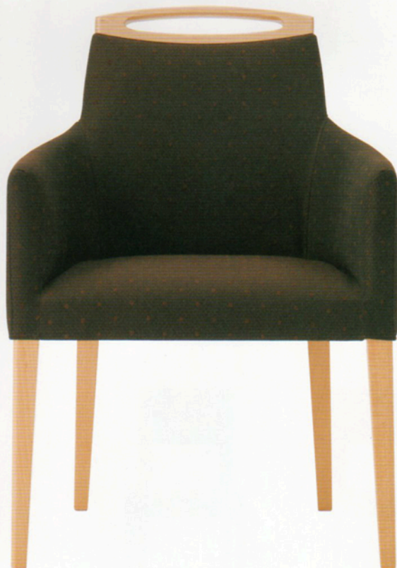
3 アモード W1 5N