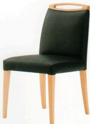
2 アモード M2 5N