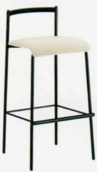
ファット 2A ¥34,755 (33,100) 張材:レザー・A-10(No.3)