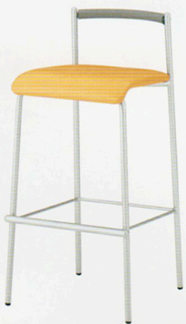
ファット 1B ¥34,755 (33,100) 張材:レザー・A-10(No.40)