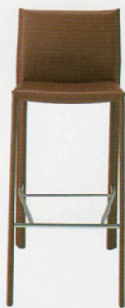
3 ロレスカウンター 3