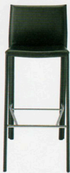
2 ロレスカウンター 1