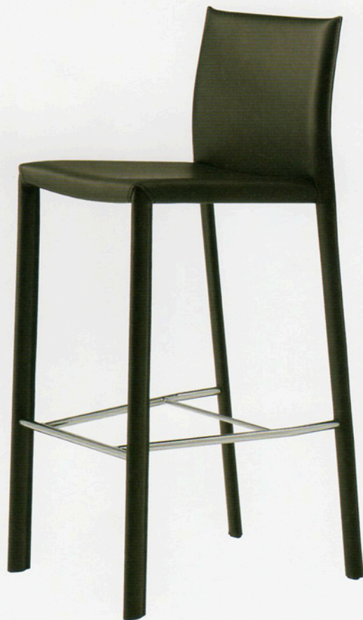
1 ロレスカウンター 2